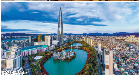
ソウルロッテタワー

日程延長プラン (最大8日間) ※お申込の際にご選択下さい (予約完了後の変更はできません) ◆グループ単位でお申し込み下さい ◆延泊の場合は延泊代金を追加して下さい。◆1名一室の場合の延泊代金は、1泊あたり延泊代金+1名部屋追加代金(延泊代金×2)となります ◆8日間を超える日程の延長はできません ◇宿泊手配を伴わない飛び泊も承ります