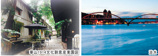
華山1914文化创意産業園区