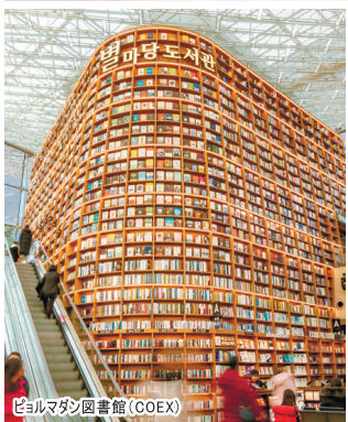
ヒョルマダン図書館(COEX)