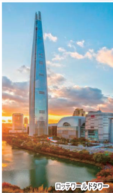
ロッテワールドタワー