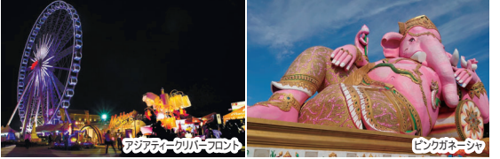
ピンクガネーシャ